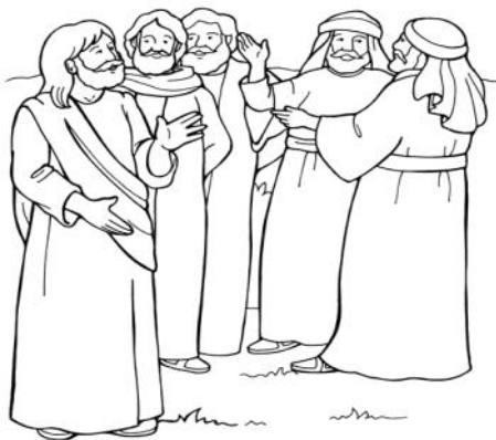
Jesus' First Followers John 1

Det er på vejen, at gæsterne til kongesønnens bryllup findes - de gæster, der tager imod indbydelsen med glæde i modsætning til alle dem, der hellere ville blive hjemme hos sig selv sammen med marker, okser og ægtefæller.